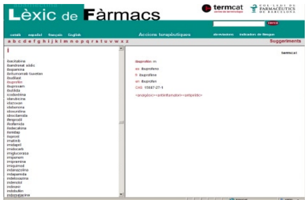
Figura 3. Versió en línia del Lèxic de fàrmacs.

Una obra com el Lèxic de fàrmacs no es pot considerar un treball tancat, atès que recull terminologia d'un àmbit en evolució constant. Per això, amb la voluntat de continuar-ne l'actualització i de revisar-ne el contingut de manera àgil i regular, s'ha creat la versió en línia d'aquest lèxic, consultable des dels webs del TERMCAT ( www.termcat.cat ) i del Col·legi de Farmacèutics de Barcelona ( www.cofb.net ). Gràcies a aquesta eina, els usuaris podran aportar els seus comentaris per millorar l'obra a l'adreça electrònica informacio@termcat.cat .